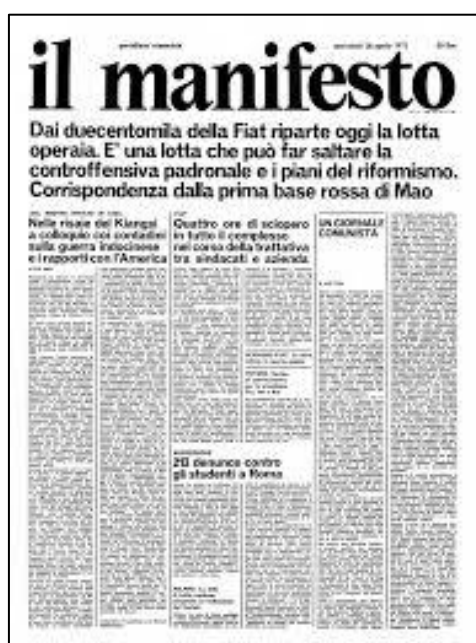
Prima pagina del primo numero de «Il Manifesto»

Ma quella scuola di ascolto reciproco è stata bella e fertile, ed è una delle tecniche che raccomanderei ai posti fisici o virtuali dove si confeziona l'informazione. Dai quali forse mi risponderebbero che quello era un altro mondo, e che – come ho appena scritto – l'intenzione principale era il messaggio politico (o l'ideologia, detto con connotazione negativa), non la Notizia: senonché, non è proprio la perdita di un pur minimo ruolo nell'aiutare a interpretare il mondo, uno dei piccoli problemi del giornalismo oggi? Leggere prima di scrivere, e cercare di comprendere a fondo i fenomeni prima di dare etichette, e conoscere, e ascoltare, possono tutte essere attività un po' pesanti e scomode per gran parte del giornalismo; ma allo stesso tempo sono quelle che hanno portato Rossana ad avere delle intuizioni e delle posizioni al momento eretiche – molto, anche rispetto al suo stesso gruppo di già eretici – ma poi rivelatesi giuste, o quantomeno illuminate: come quella sul terrorismo italiano e sull'appartenenza delle Brigate Rosse all'album di famiglia della sinistra.